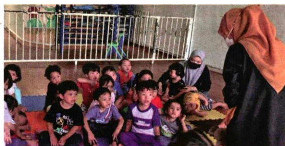
Kerajaan Selangor wajar memberikan perhatian kepada taska supaya pengusaha kembali bernafas setelah terjejas akibat pandemik Covid-19.