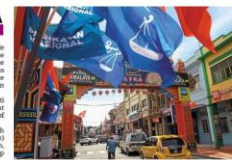
Lively spot: Political coalition flags in the recent election added colour to the busy Jonker Street in Melaka.