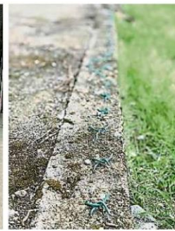
篮球场旧的铁丝围篱经常遭人破坏, 甚至剪走。