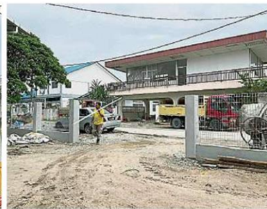
左图: 新村篮球场的石砖防攀围篱, 也将村内的公共儿童游乐设备一并围起, 避免遭到不负责任者的破坏。