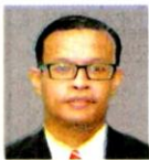
Pensyarah Kanan, Universiti Pendidikan Sultan Idris