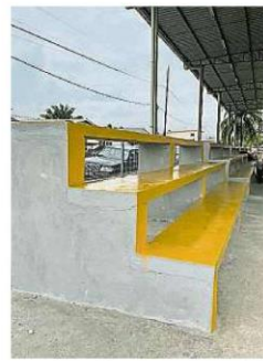
5座观众席可容225人同场观赏球赛。