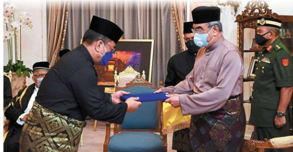
13th Chief Minister: Datuk Seri Sulaiman Md Ali (left) receiving the Instrument of Office from Yang di-Pertua Negeri Tan Mohd Ali Rustam during the swearing-in ceremony in Ayer Keroh.

The Melaka election, which Barisan Nasional won by a landslide, indicates that the voting trend to support the Opposition has been reversed. Political analysts believe there is a new political dynamic in the country. For some of the winners, work has already started. > See reports on pages 4, 6 & 8