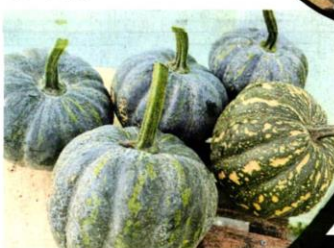
■南瓜的收成丰硕, 归功于种植者采用本地生产的有机肥, 加上细心的照料。

望这款产品获得大家的喜爱, 可以连同村里其他家庭主妇一起制作更多BP醬来满足市场需求, 让大家有额外收入, 同时吃得健康, 一举多得。