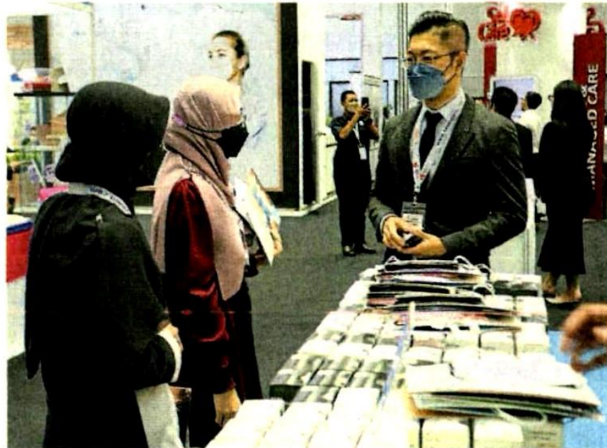
■ 2021雪州国际商务峰会 (SIBS) 获得热烈反应。